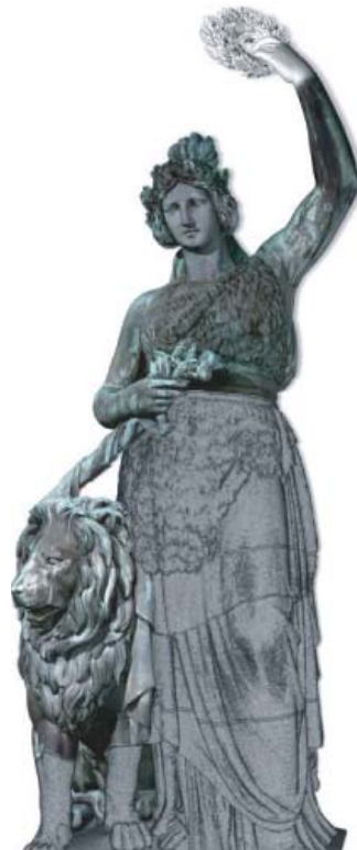
Bavaria - München. 3D-Dokumentation der 18m hohen Monumentalstatue

und Qualitätssicherung an das von uns entwickelte 3D-Informationssystem aSPECT 3D übergeben werden. Aus den Modelldaten wurden kleinmaßstäbliche CNC- und RP-Modelle erstellt. Schließlich konnte die Bavaria digital in Computeranimationen für Film, Internet und Multimedia-Präsentationen aufbereitet werden.