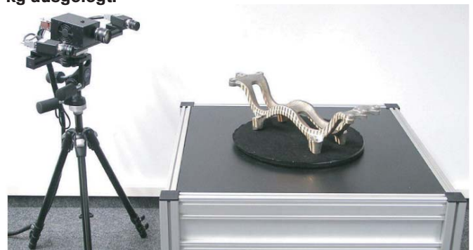
Portabler 3D Scanner und elektronischer Drehtisch

Der Drehtisch vereinfacht und beschleunigt die Objekterfassung für eine Vielzahl von Objekten. Alle in einer 360°-Drehung erfassten Daten werden automatisch in ein gemeinsames Koordinatensystem übertragen. Angepasst an das Gewicht der zu vermessenden Objekte ist der Drehtisch bis zu einem Gewicht von maximal 200 kg ausgelegt.