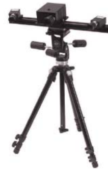
Der 3D-Scanner mit zwei hochauflösenden Kameras und dem Streifenlichtprojektionsgerät in der Mitte

Die Objektgröße kann kleiner oder auch größer als der Meßbereich sein. Objekte, die über das eingestellte Messfeld hinausragen, können mit der QT Sculptor-Software passgenau anhand von korrespondierenden Flächen zusammengefügt werden. Das Anbringen von Markierungen auf dem Objekt ist nicht erforderlich.