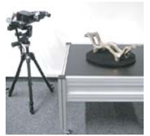
Portabler 3D-Scanner und Drehtisch