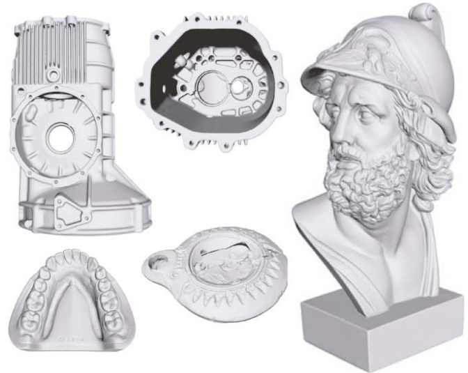
Beispielanwendungen aus der Industrie, Medizin und Kulturgutdokumentation.