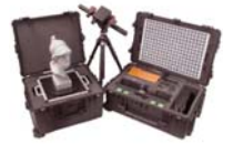
Transportkoffer mit sämtlichem Zubehör

Die QT Sculptor-Software unterstützt die unkomplizierte Integration von Detailscans in bereits vorhandene Datensätze zur Optimierung der Informationsdichte. Die Ansteuerung des Scanners kann über einen handelsüblichen PC oder Laptop erfolgen.